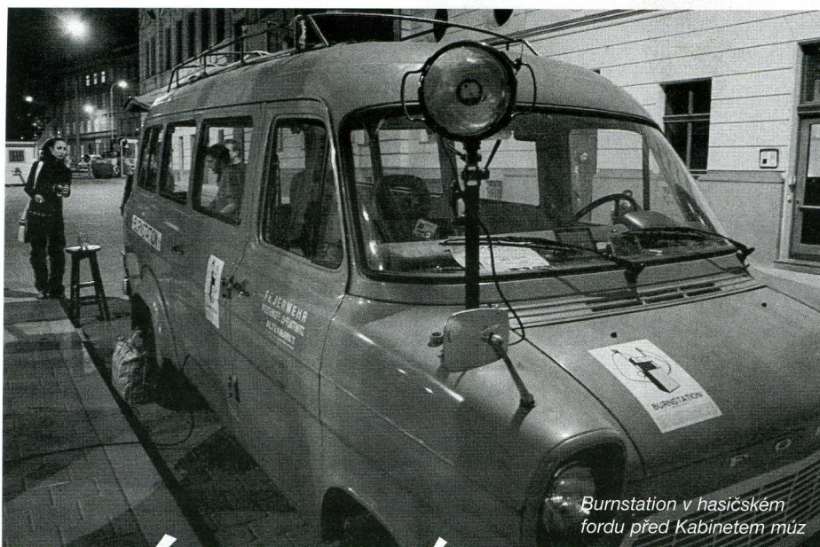
Burnstation v hasičském fordě před Kabinetem múz